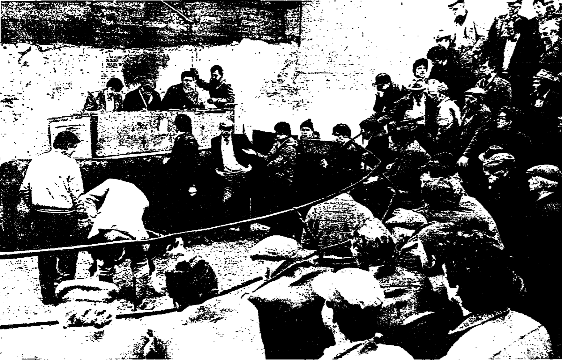
لاحو مدينة سترابان، يجتمعون مرتين في الأسبوع لمخاضات زراعية